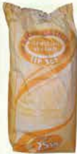
Pšenično brašno Gebi TIP-500 25kg

28% Stara cijena 2,50 1,95 KM AKCIJSKA CIJENA