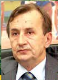
GRADONAČELNIK HUSEJIN SMAJLOVIĆ