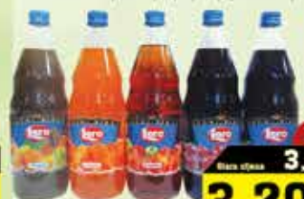
Lero 1L Naranča | Limun | Tropic | Vljnja | Boronica | Jabuka

9% Stara cijena 3,50 3,20 KM AKCIJSKA CIJENA