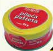
Pileća pašteta Eco 95g

17% Stara cijena 1,00 0,85 KM AKCIJSKA CIJENA