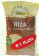
Riza Zlatno zrno 800g

13% Stara cijena 2,95 2,60 KM AKCIJSKA CIJENA