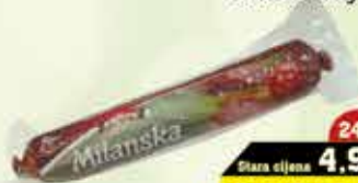
Milanska kobasica JURČEVIĆ 300 g

24% Stara cijena 4,90 3,95 KM AKCIJSKA CIJENA