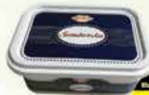
Feta sir Somborska 250g

13% Stara cijena 2,95 2,60 KM AKCIJSKA CIJENA