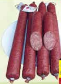
Domaća kobasica 260 g

24% Stara cijena 8,00 6,45 KM AKCIJSKA CIJENA