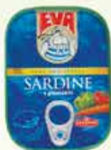
Riba Eva s povrćem 115g

17% Stara cijena 1,00 0,85 KM AKCIJSKA CIJENA