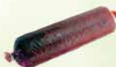
Goveđi kulen "JURČEVIĆ" 400 g

38% Stara cijena 3,45 2,50 KM AKCIJSKA CIJENA