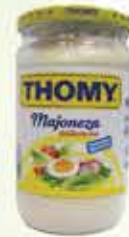
Majoneza Thomy teгла 650ml

8% Stara cijena 3,20 2,95 KM AKCIJSKA CIJENA