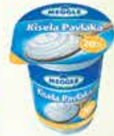
Kiselica vrhnje 410g 20% Meggle

9% Stara cijena 2,30 2,10 KM AKCIJSKA CIJENA