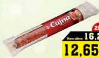
Čajna kobasica XXL 650g Pik Vakumirana

28% Stara cijena 3,40 2,65 KM AKCIJSKA CIJENA