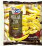
Mahuna žuta Ledo 450g

14% Stara cijena 1,20 1,05 KM AKCIJSKA CIJENA