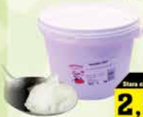
Svinjska mast 1 kg

38% Stara cijena 3,45 2,50 KM AKCIJSKA CIJENA