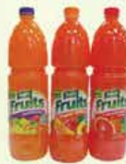
Fruits 1,5L Crvena naranča Multivitamin Naranča nektar

20% Stara cijena 2,10 1,75 KM AKCIJSKA CIJENA