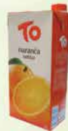
Sok TO Naranča nektar 2L

5% Stara cijena 21,00 20,00 KM AKCIJSKA CIJENA