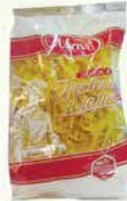
Rezanac 8 Mavi - 400g

14% Stara cijena 1,15 1,00 KM AKCIJSKA CIJENA