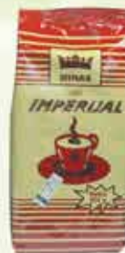
Kava Imperijal 500g

28% Stara cijena 2,50 1,95 KM AKCIJSKA CIJENA