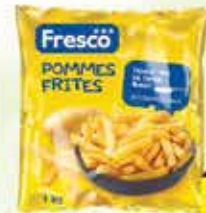
Pommes frites Fresco Ledo 1kg

6% Stara cijena 5,25 4,95 KM AKCIJSKA CIJENA