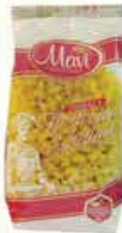
Pužići mini Mavi 400g

28% Stara cijena 2,50 1,95 KM AKCIJSKA CIJENA