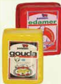
Gouda sir Paladin 500g Sir Edamer Paladin 500g

17% Stara cijena 4,30 3,65 KM AKCIJSKA CIJENA