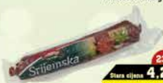
Srijemska kobasica "JURČEVIĆ" 300 g

23% Stara cijena 4,25 3,45 KM AKCIJSKA CIJENA