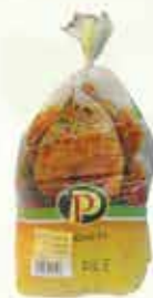
Pilići PP zamrznuti

4% Stara cijena 14,50 13,90 KM AKCIJSKA CIJENA