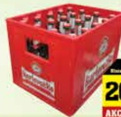
Karlovačko pivo 0,5L gajba 20 kom

14% Stara cijena 2,85 2,50 KM AKCIJSKA CIJENA