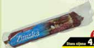
Zimska kobasica 300 g "JURČEVIĆ"

27% Stara cijena 4,40 3,45 KM AKCIJSKA CIJENA