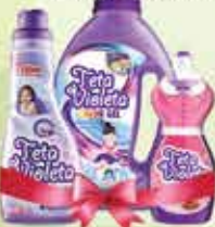
Teta Violeta Color 1,5L + Omekšivač Sensitive 1,25L + Intense 0,5L Teta Violeta Color 1,5L + Omekšivač Sunshine 1,25L + Intense 0,5L Teta Violeta Color 1,5L + Omekšivač Original 1,25L + Intense 0,5L Teta Violeta Color 1,5L + Omekšivač Lagoon 1,25L + Intense 0,5L

25% Stara cijena 1,50 1,20 KM AKCIJSKA CIJENA